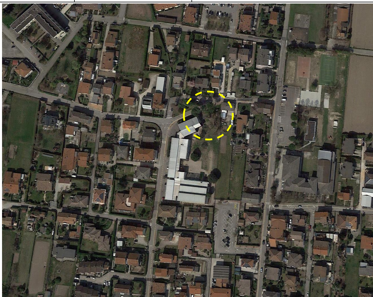
Estratto ortofoto con individuazione dell'area di intervento