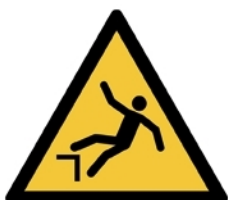
W008 - Caduta con dislivello