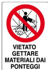
Vietato gettare materiali dai ponteggi