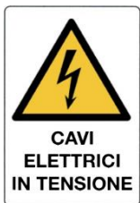
Cavi elettrici in tensione