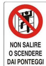
Vietato salire o scendere dai ponteggi senza l'utilizzo delle apposite scale