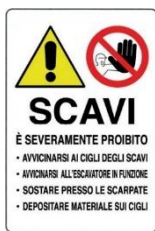
Divieto di accedere o sostare in prossimità di scavi