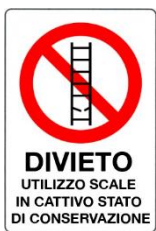
Divieto di utilizzo scale in cattivo stato di conservazione