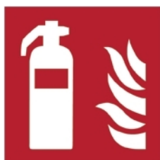
F001 - Estintore