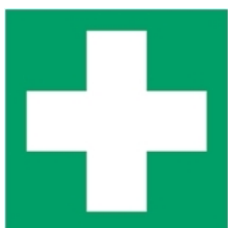
E003 - Pronto soccorso