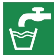
E015 - Acqua potabile