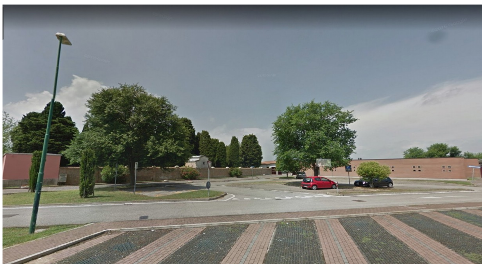
Figura 4: Foto F4