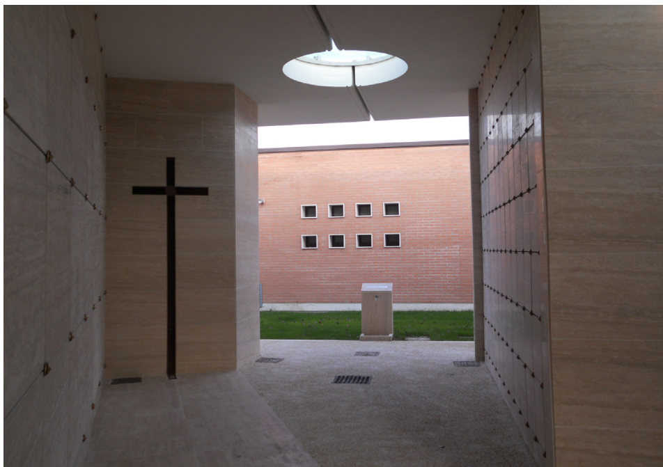
Figura 6: Foto F6