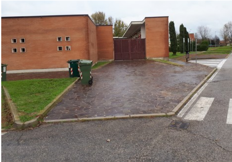
Figura 3: Foto F3