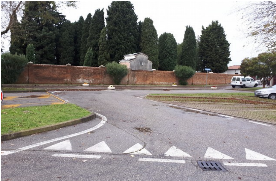
Figura 2: Foto F2