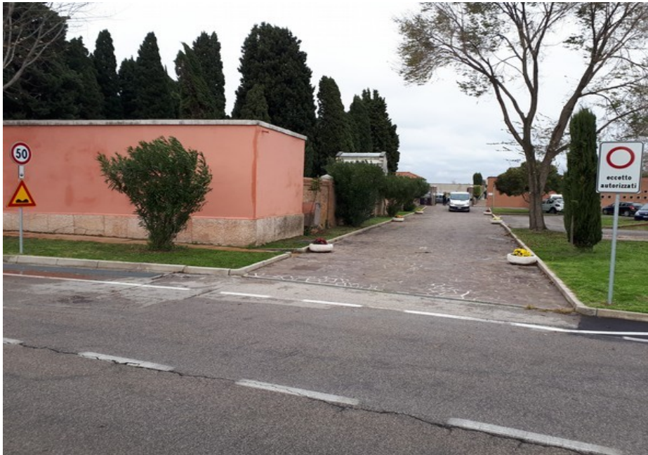
Figura 1: Foto F1