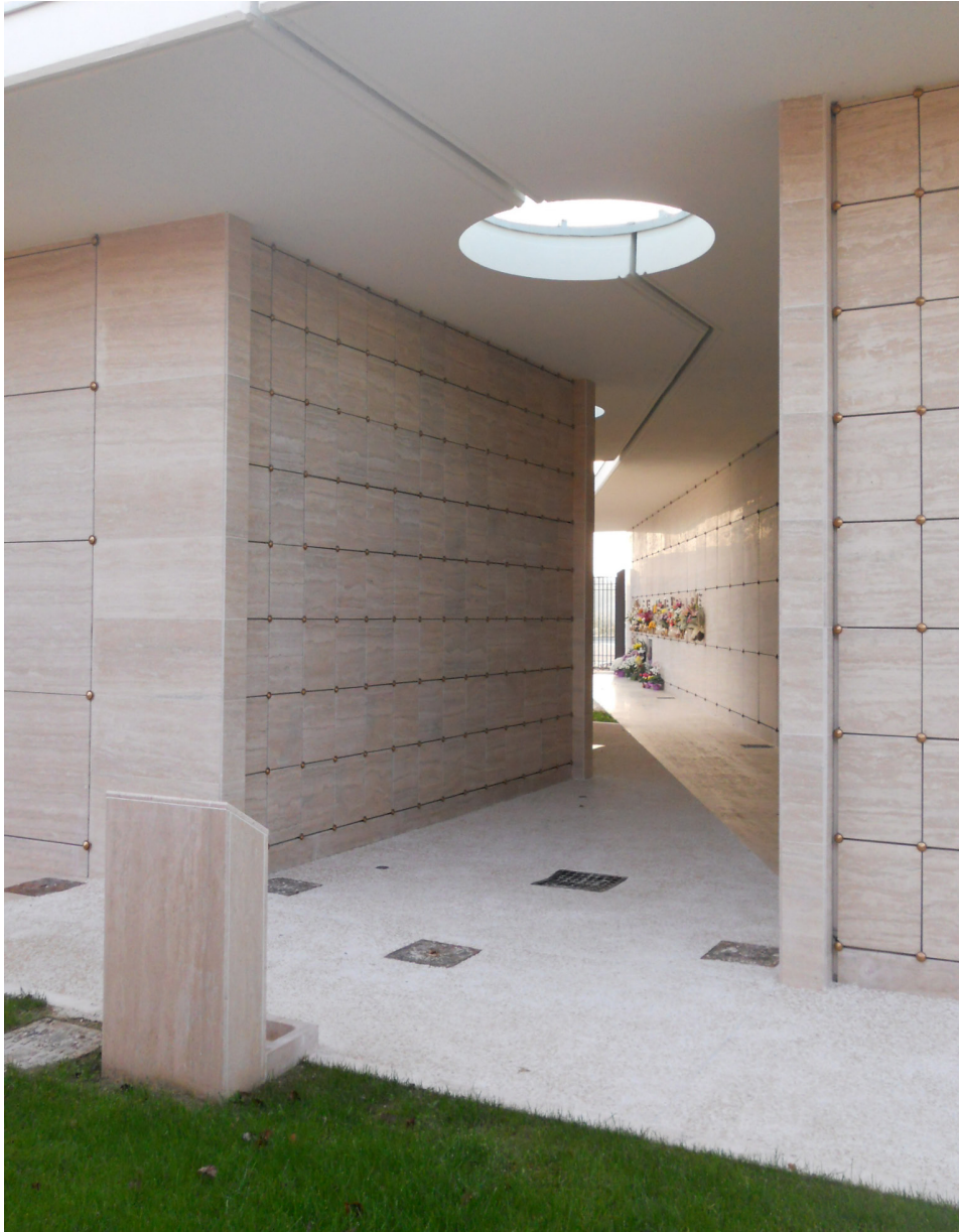
Figura 7: Foto F7