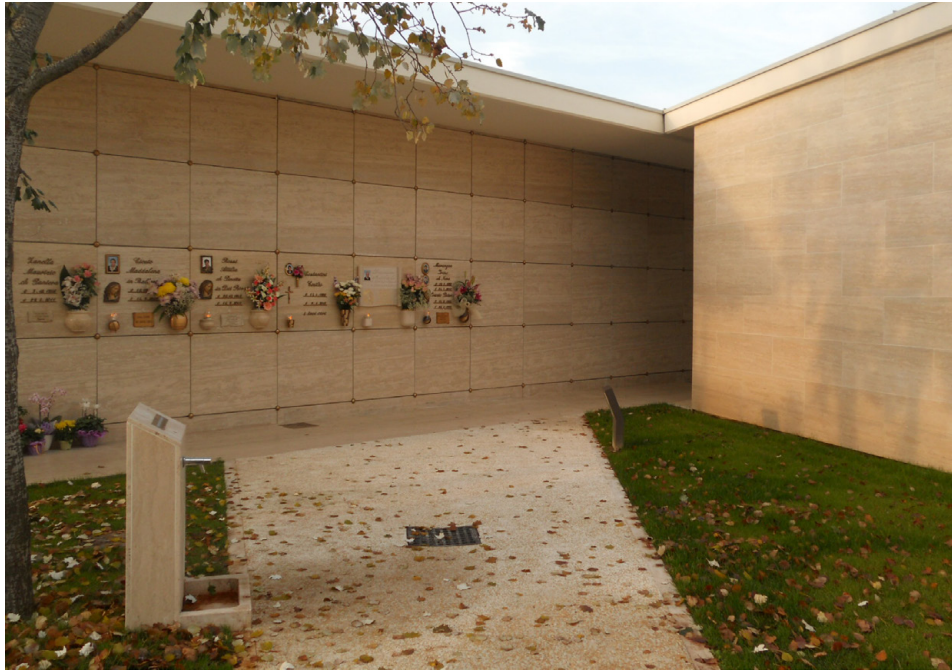
Figura 5: Foto F5